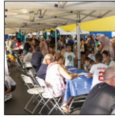
Forum des sports p.4