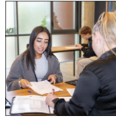
Rendez-vous emploi p.8