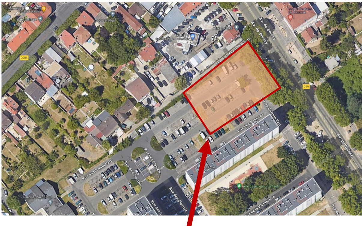
Emprise du projet