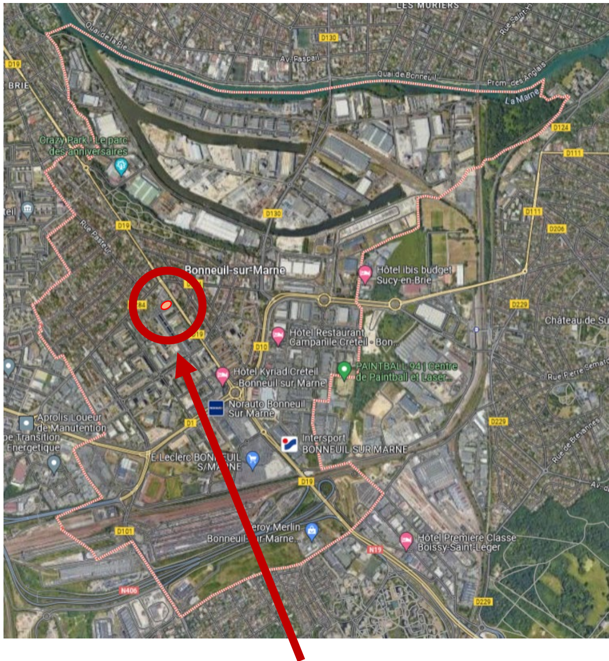
Emplacement de la portion de voirie à déclasser

L'emprise à déclasser se trouve sur le parking Saint-Exupéry, entre la rue des Clavizis à l'ouest, l'avenue de Boissy à l'est, l'impasse des beaux regards au nord et la rue des Aunette au sud.