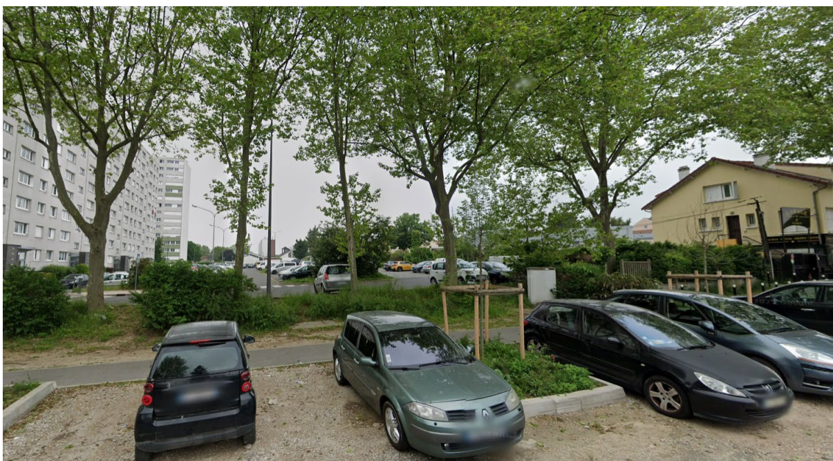
Vue depuis le l'avenue de Boissy