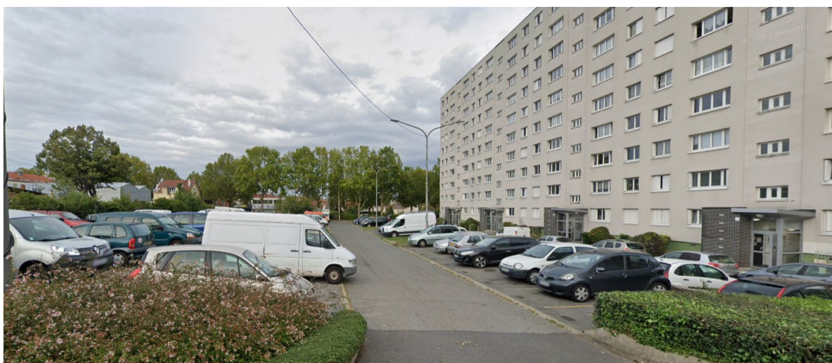
Vue de la voirie depuis le sud-ouest