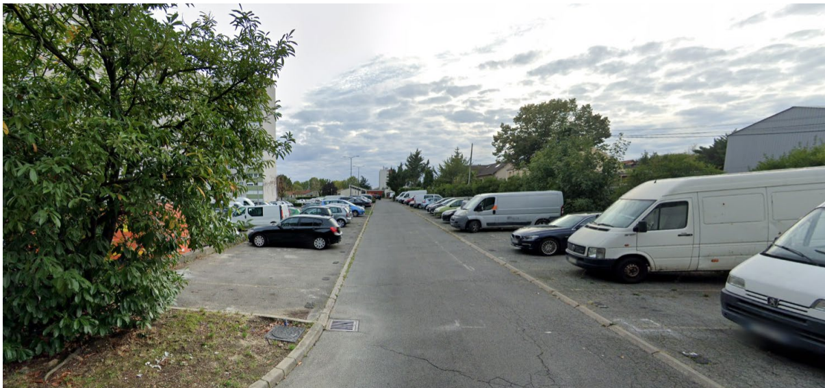
Vue depuis le nord-est de la voirie